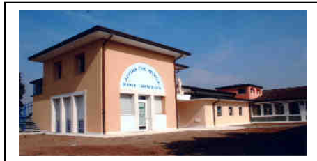
Inizio Scuola dell'Infanzia Pilastro Lunedì 13 settembre 7,30 - 16,30. C'è il servizio pulmino