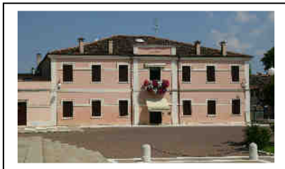
La Scuola Materna del Sacro Cuore di Gesù inizia le attività lunedì 13 settembre.